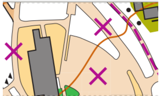
Viitoitus ja kiellettyjä alueita.

Sunnuntain kilpailussa ylitetään kaksi runsas risteyksistä aluetta. Näiden alueiden ohittamiseen on kilpailukartalle piirretty viitoitus. Viitoitusta ei ole merkattu maastoon. Viitoitus on pakollinen eikä viitoitukselta saa poistua. Sen lisäksi kielletyt reitit ovat pääsääntöisesti merkitty kilpailukarttaan.